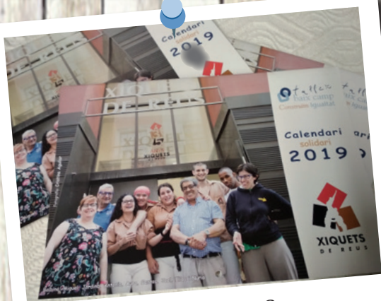
Calendari amb els Xiquets de Reus