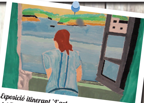
Exposició itinerant 'L'art amagat del Taller Baix Camp'