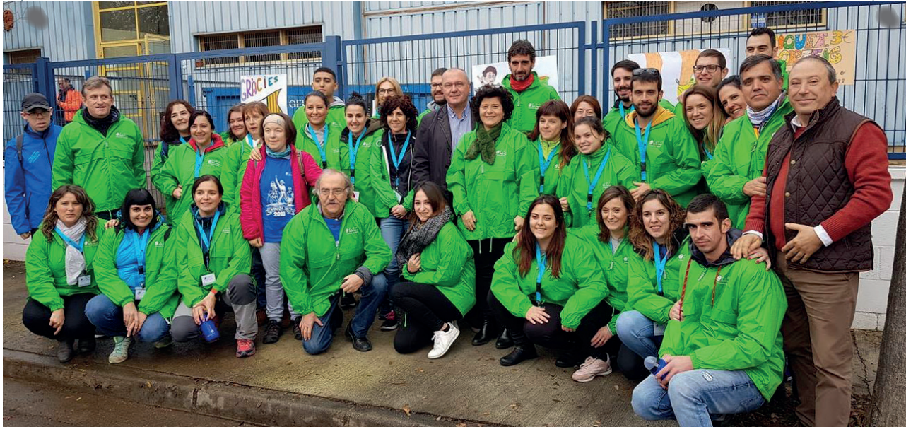
Primera caminada solidària del Taller Baix Camp