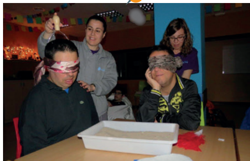
Sala multisensorial al Punt de Trobada